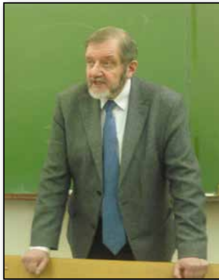
Владимир Александрович открывает тайны кухни журналистики

Не надо удивлять читателей какими-то заумными мыслями - ещё одно правило журналиста. Когда человек первый раз опубликовался, ему кажется, что он выше аудитории. Абсолютно неверно: публика всегда умнее.