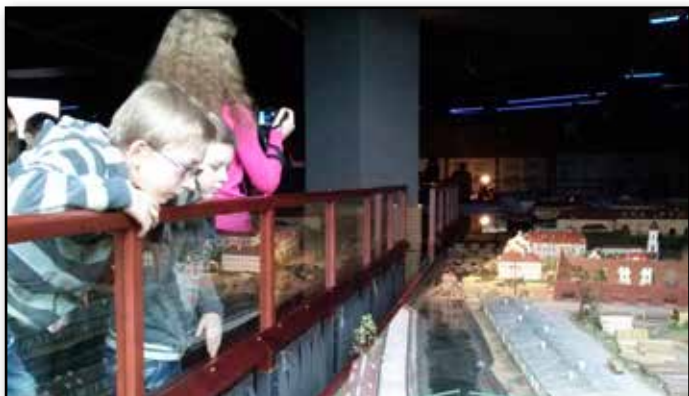
На победном пути к Рейхстагу

В озможность увидеть Петербург времен Петра, Екатерины, в костюмах, с мельчайшими подробностями, дает уникальный театр-макет «Петровская акватория». 25000 персонажей, 100 различных судов, около 1000 зданий в масштабе 1:87. Макет - это история возникновения Северной столицы и зарождения флота в интерактивной миниатюре. Почему интерактивной? Нажатием одной из зеленых