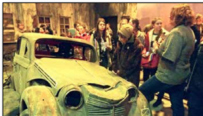
Поколение 21 века отправляется по следам знаменосцев

Заходя в павильон, посетители попадают в разрушенные, изуродованные войной, комнаты. Сохранились дорогие обои, картины, паркет, фортепьяно... Но все это осталось там - в мирной жизни. Поэтому нет ни потолка, ни стен. Затем мы выходим на улицу Берлина. Перед нами застывшая картина боя 30 апреля 1945 года. Вокруг оружие, военная техника, предметы быта, завеса дыма. Осталось совсем чуть-чуть до королевской площади и