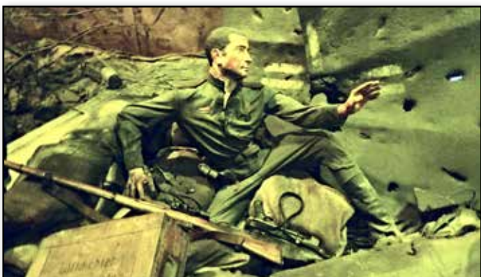
На победном пути к Рейхстагу

Т рехмерная панорама «Битва за Берлин. Подвиг знаменосцев» посвящена 70-летию победы нашей страны в Великой Отечественной войне. Автор идеи военно-исторической панорамы – Дмитрий Поштаренко. Данный проект реализован на средства Президентского гранта. Панорама позволяет посетителям выставки представить последние дни войны, оказаться у стен Рейхстага, побывать в ряду первых знаменосцев Советской армии, прочувствовать атмосферу приближения грандиозной победы.