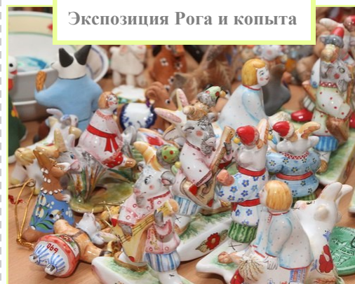
Экспозиция Рога и копыта

П осещение экспозиции Рога и копыта – это, пожалуй, самый уникальный экспонат. Этот новаторский, самобытный музей подтолкнул на мысль, которая тут же очутилась в моей копилке: «В культурной столице изобилие духовных мест, но проблема в том, что мероприятия, не слишком масштабные зачастую проходят мимо даже заинтересованного человека». Так происходит с частными коллекциями и выставками, которые восхитят публику и в скором времени исчезнут. Невозможно быть всегда и всюду, но очень жаль, когда увлекательное мероприятие прошло, о котором ты не слышал, но очень хотел бы посетить. Но конкурс подарил нам возможность посещения музеев, в которых мы вряд ли бы побывали.