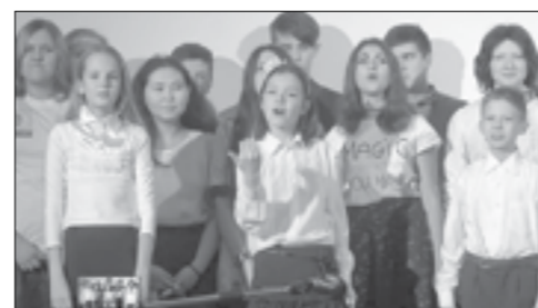
кадры из выступлений взяты с сайта youtube.com/academclasses

все: из обрывков ткани сделали платья девочек, из фольги — клетку для птицы, кошку — из кусочки искусственного меха. Самым трудоемким оказался фон — сперва надо было нарезать мелких глянцевых бумажек нужного цвета, а потом наклеить их на ткань-основу. Девятый класс готовил мастер-классы по изготовлению разных деталей картины, а когда приезжали гости, показывал, как превратить вату в волосы девочек или сделать фрукты из гипса. Мы закончили картину, успешно ее презентовали и продолжаем общаться до сих пор.