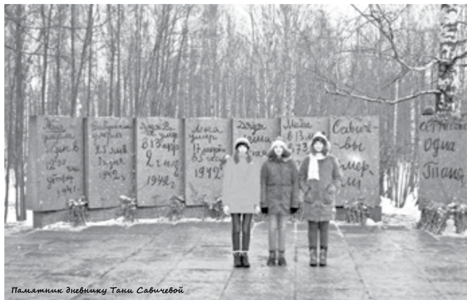
Памятник дневнику Тани Савичевой