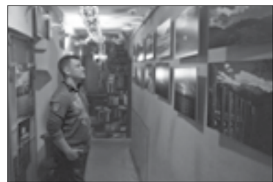
Все фото взяты с персональной странички Вячеслава Березовского «ВКонтакте»: http://vk.com/vyacheslav.berezovskiy

Мой папа, Вячеслав Юрьевич Березовский, увлекается фотографией: он делает портреты людей, а также разные пейзажи. За свою жизнь он сменил много разных профессий, но с фотографией «дружил» всегда.