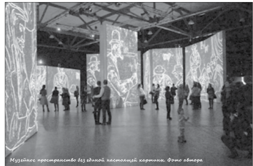
Музейное пространство без единой настоящей картины.

На выставке были люди всех возрастов: как зрелые ценители, так и юные открыватели... Как говорится, для искусства нет ограничений. Помимо картин было и несколько черных стен, на которых появлялись высказывания великих художников. Все это настолько захватило меня, что я не хотела уходить, а после еще долго находилась под приятным впечатлением. Интересно получается. Организовать выставку можно теперь, имея лишь несколько стен и проектор! Было бы желание. Прекрасное из ничего! Это может вдохновить человека не меньше, чем величие самих картин. Единственным минусом мероприятия для меня оказалось сломанное отопление. При входе нам даже посоветовали не снимать куртки. Но это оказалось