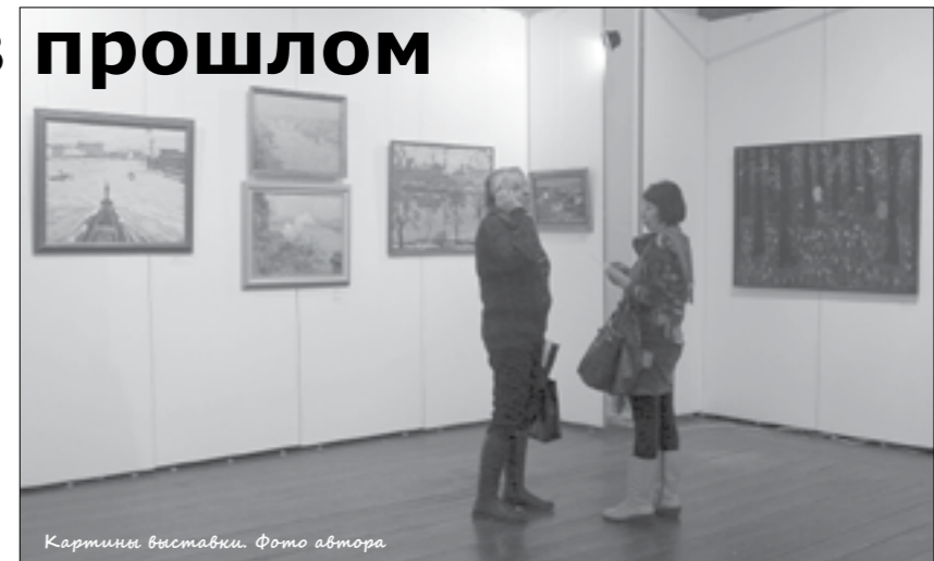
Картины выставки.

Мрачная, но запоминающаяся «Исаакиевская площадь» Георгия Татарникова точно передает атмосферу города. Грустная и необычная картина нарисована в серых тонах. Идет дождь, облака полностью закрывают небо. На переднем плане под зонтом идет человек, в мокром асфальте отражаются собор и памятник Николаю I.