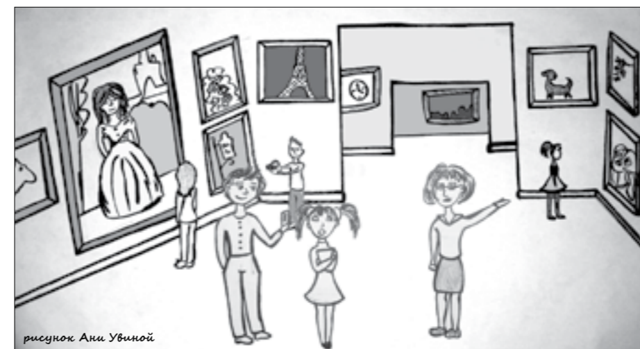
рисунки Ани Увиной

Мне нравится бывать в музеях, но только одной или с друзьями, чтобы посмотреть именно то, что меня привлекало. А вот ходить за экскурсоводом или с родителями я просто терпеть не могу: как правило, экскурсия длится очень долго, рассказывают много и непонятно, что приводит в уныние. А с родителями приходится надолго останавливаться у каждого экспоната, часто они еще просят меня встать рядом с ним, чтобы сделать фото, хотя я совсем не хочу фотографироваться с каждой статуей.