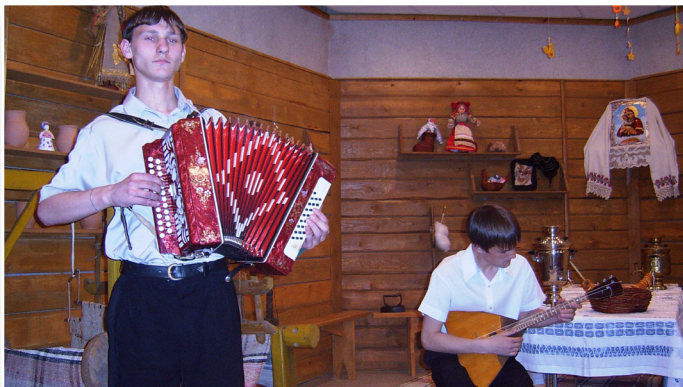
Русские посиделки в музее избы

Уже несколько лет во Дворце творчества детей и молодежи существует музей «Русской избы».