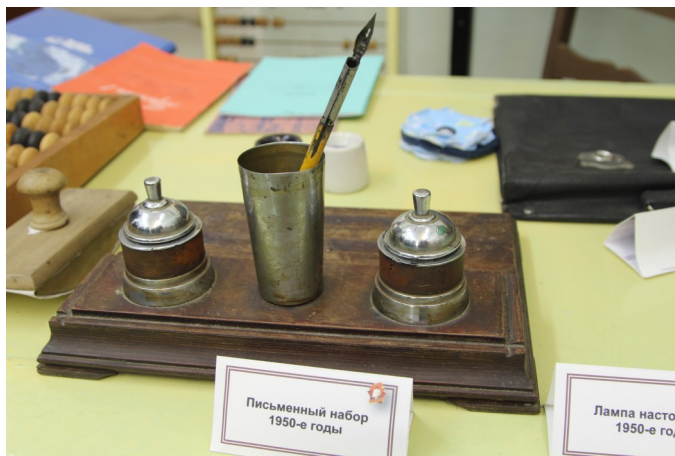
Письменный набор 1950-е годы

Писать пером не так-то просто. Учили этому детей с первого класса на специальном уроке, который назывался «Чистописание». Писали чернилами фиолетового цвета.