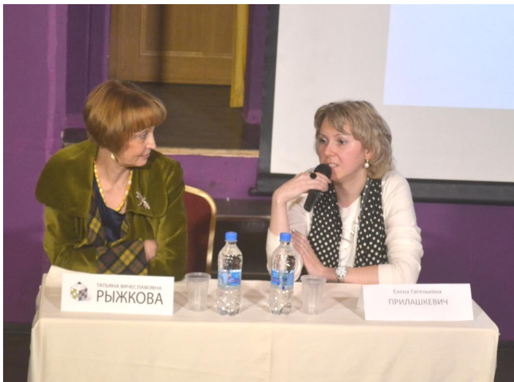
В подробностях про музеи