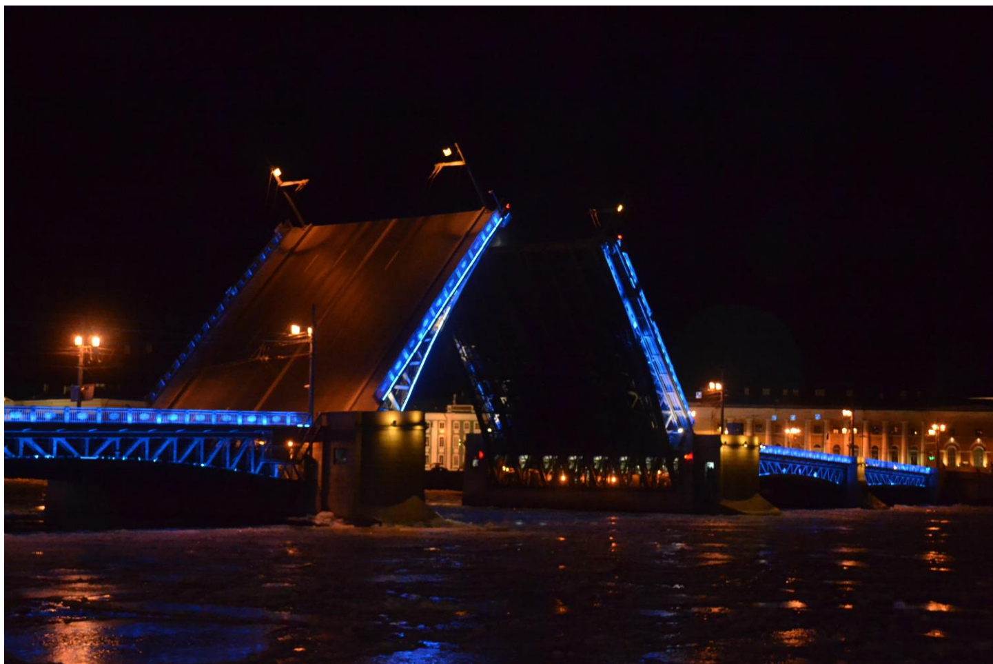
Нева... Великолепный вид! (Сплин)