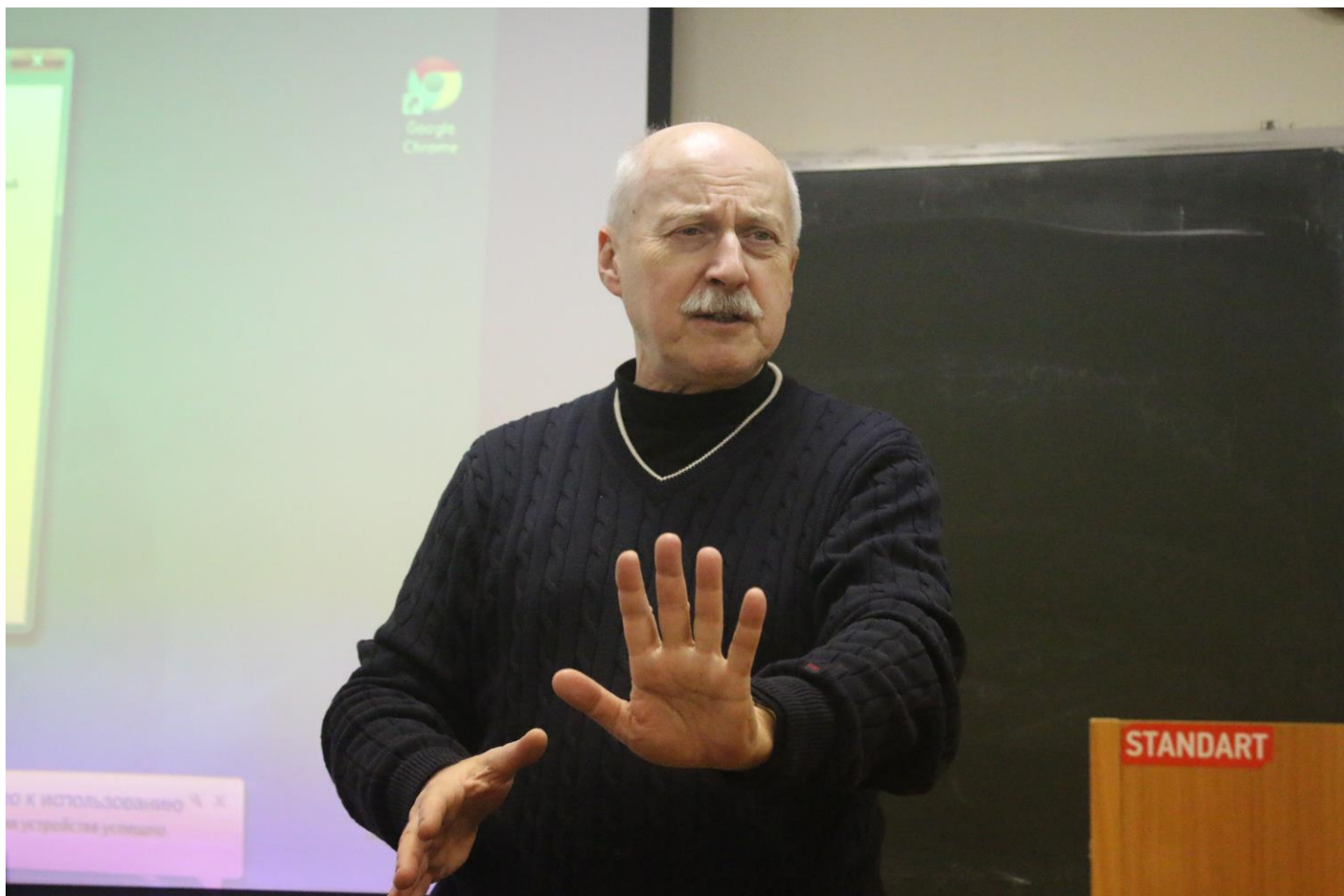
Мастер предупреждает от ошибок

В целом - это были очень продуктивные 3 дня. Думаю, моя коллекция питерских воспоминаний ещё никогда не была настолько интересной и яркой.